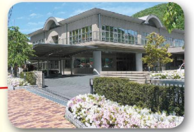
あったかこうち応援センター (河内保健福祉センター)