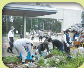
瓦礫の分別・撤去