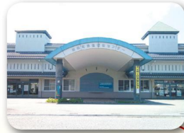
あったかとよさか応援センター (豊栄保健福祉センター)