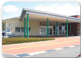
あったかろせ応援センター (黒瀬保健福祉センター)