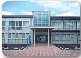
あったかふくとみ応援センター (福富保健福祉センター)