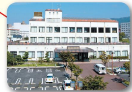
あったかひがしひろしま応援センター (東広島市総合福祉センター)