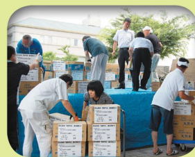
支援物資の仕分け・搬送