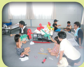
子どもの遊び相手