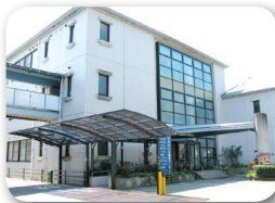
あったかあきつ応援センター (安芸津文化福祉センター)