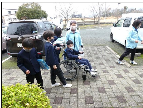
▲校外の段差を探しました。外には段差がたくさんあることが分かりました。