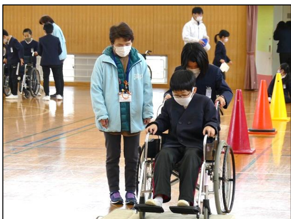
▲マットレスを置いて段差を作り、車いすで段差を乗り越えるのが、いかに難しいかを体験しました。

1月26日に入野小学校3年生26名が、河内地区民生委員児童委員協議会にお手伝いいただきながら、「車いす体験」をしました。前回の「高齢者疑似体験」と合わせて、2回目の福祉体験となりました。まず始めに体育館で、車いすの扱い方の説明や介助方法、段差の乗り越え方や狭いところの曲がり方など実際に乗って学習しました。また、車いすでの介助や自走することがどれだけ難しいかを知っていただくために、スロープの降り方、エレベーターの乗り降りや、ドアの敷居の段差等を車いすに乗って校内の障壁を体感しました。