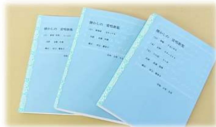
▲点字で作成された愛唱歌集

又、恒例になりました、点字による来年のカレンダーも完成に向けて着々と作 業が進められています。