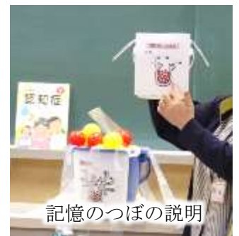
記憶のつぼの説明

これからも「認知症になっても安心して暮らせる地域づくり」を目指し、関係機関や施設、地域福祉活動者等と連携し、学校や地域等で認知症への理解を深めていただくための取り組みを推進してまいります。