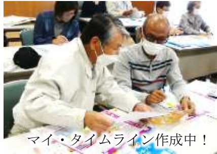
マイ・タイムライン作成中！