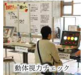
動体視力チェック