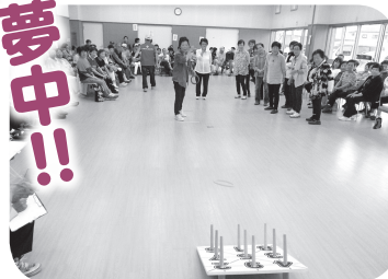
▲ボールめがけて、「エイッ!!」