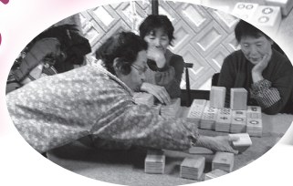
▲これがほしかったんよー!!