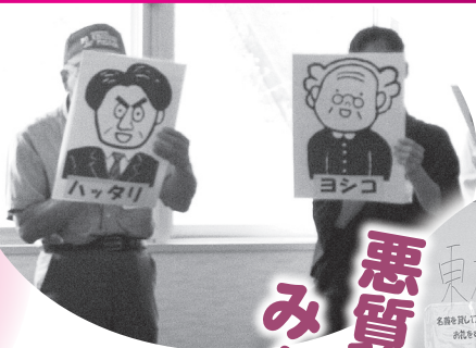
参加者主演によるペーパーサートです。

7月9日（木）に豊栄地域在宅高齢者見守り協力員交流会を開催し、悪質商法の被害防止についてペーパーサートで勉強しました。続いて「一年を振り返ってみて」をテーマにワールドカフェを展開し、各地域で活発な意見交換が行われました。