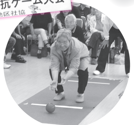
▲ねらったところに、「ヨイショッ!!」