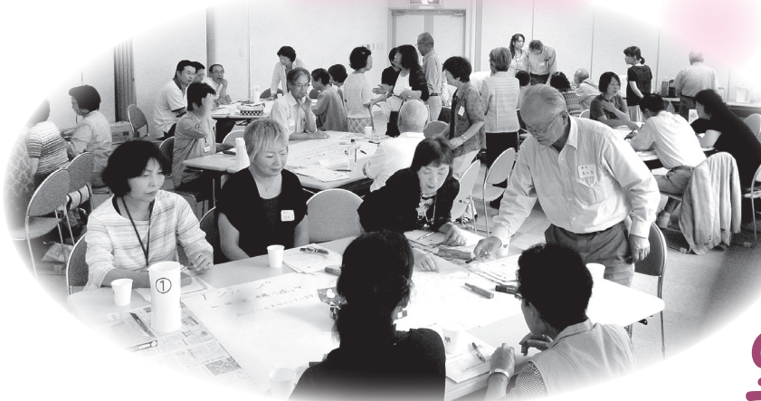
ワールドカフェ。各グループで一年間の振り返りと見守りへの思いを語り合っておられました。