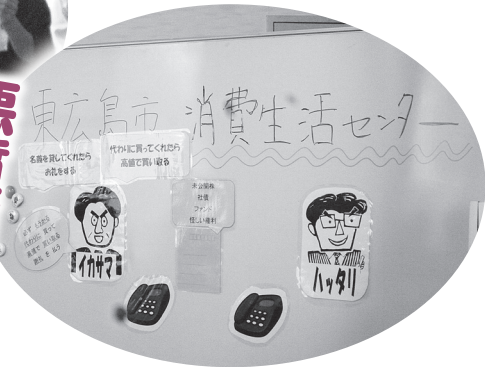
悪質商法の手口と被害防止について。