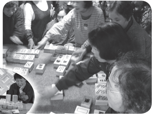
▲もう一回やろうやー!!