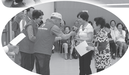
▲優勝したサロンは、「友・友」!おめでとうございます!