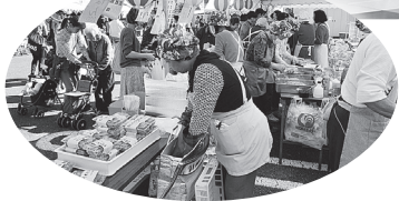
▲バザーもにぎわいました。