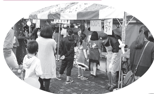
赤い羽根共同募金に協力しました!