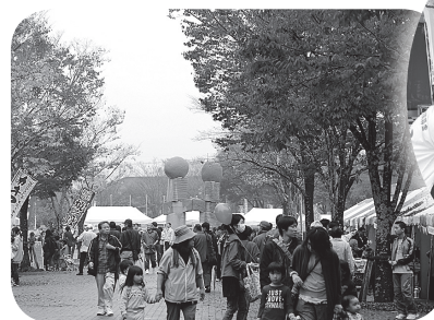
▲たくさんの方でにぎわいました。