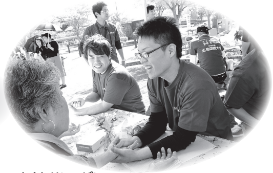
▲ぬくもりいっぱい ハンドマッサージ

また、今年初めて広島国際大学がテントブースに出展し、ハンドマッサージ、ヨーヨー釣りをを行い地域の方と交流を深めました。この他、福祉体験コーナー、福祉バザー、各種施設紹介、骨密度測定、脳年齢測定、各種相談コーナー、東広島市消防局による救急車、消防車の展示、さくらバスの紹介、屋外バザーの飲食ブースにも多くの来場者が訪れ盛大なまつりになりました。地域の皆さん、ご協力ありがとうございました。