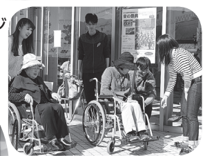
▲広島国際大学ボランティア部 「つづ」の車いす体験