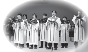
▲素晴らしい演奏に観客の皆さんも魅了されました