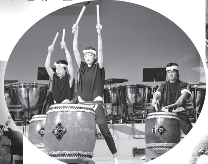
▲迫力ある和太鼓演奏に みんな圧倒！