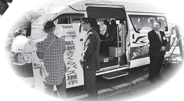
▲あなたのお出かけをお手伝い！地元黒瀬バス