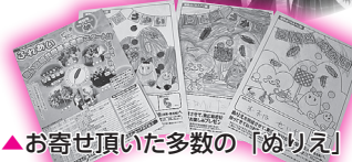
▲お寄せいただいた多数の「ぬりえ」

「ふれあい」特別号(10月号)の「ぬりえ」にたくさん力作をお寄せ頂き、ありがとうございました。作品は本所、各支所にて展示されています。みなさんで見に来て下さいね。