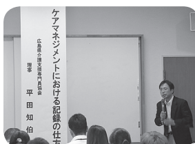
▲法令遵守を記録に残すポイントは？