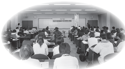
◀ケアマネジメントのプロセスごとの記録について確認！