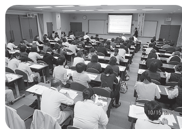
▲皆さん熱心に記録の仕方を記録しています。