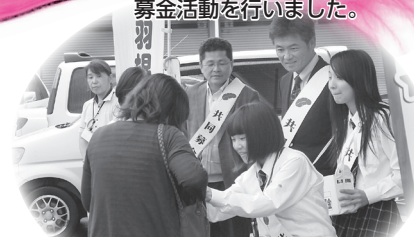
▲安芸津地区：豊田高校の生徒も一緒に頑張りました。