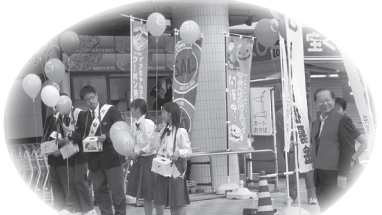
▲黒瀬地区：黒瀬高校の生徒も一緒に取り組んでくれました。