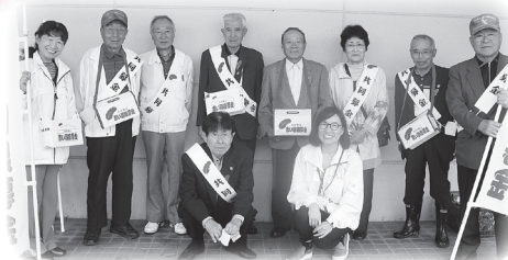
▲豊栄地区：地域の方と一緒に街頭募金を行いました。