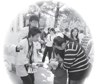
▲東広島地区：酒まつりで大学生と一緒に募金活動