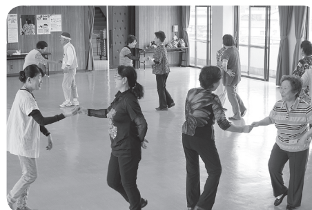
▲レクリエーションダンス 講座