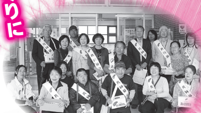
▲河内地区：3日間にわたって町内で募金活動を行いました。