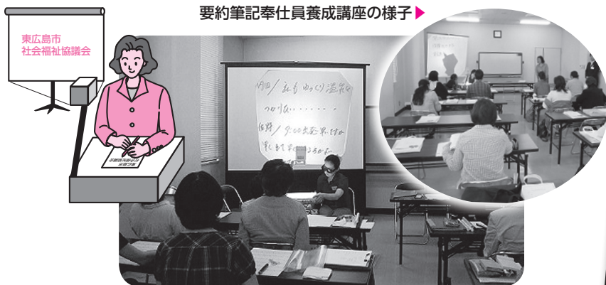
要約筆記奉仕員養成講座の様子▶