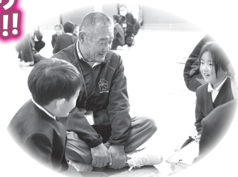
▲民生委員児童委員の皆さんと一緒に優しい声かけについて考えました

児童からは「声かけの大切さを学んだ」、「家に帰って今日勉強したことを家族で話す」と感想を聞かせてもらいました。みんな今日から地域の小さな見守り隊です！