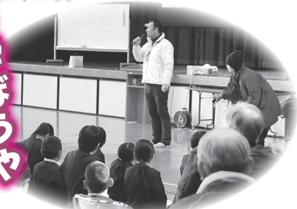
▲認知症について教えていただきました