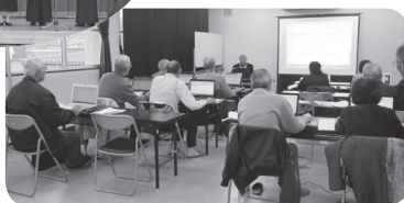
▲パソコン講座高屋教室