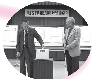
▲ドキドキしながらくじを引くのを見守りました