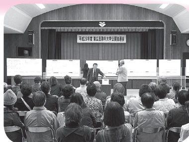
▲多くの参加者で賑わいました

来られた方の多くはドキドキしながら、抽選結果を待っておられ、歓声や悲鳴が沸き起こっていました。