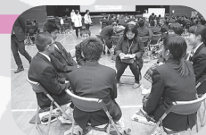
認知症サポーター養成講座