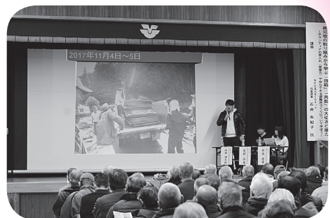
▲ボランティアの取り組み発表