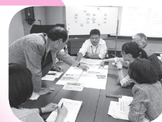
地域課題に向けた協議