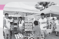
“夏企画”ボランティア活動