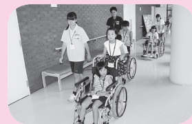
▲夏休み子ども向け福祉体験学習