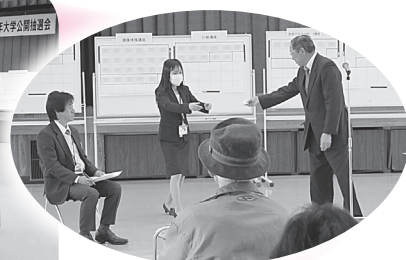
▲ドキドキしながらくじを引くのを見守りました