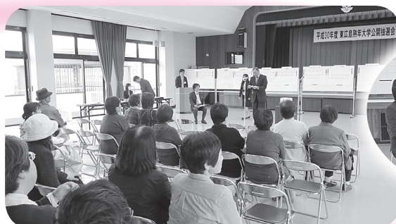
▲多くの参加者で賑わいました

応募者が募集人数を超えた11講座12教室を対象に抽選を行い、約40名の方が抽選の様子を見守りました。