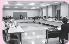
▲福祉をすすめる会