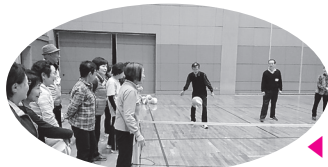
◀ ニュースポーツ講座