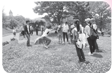
▲ボランティア企画の実施(遠足企画)