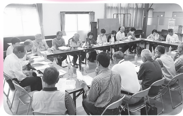
▲別府地区「おたがいさまネット」会議の様子

地域の高齢者や障害者、見守りが必要な方が長年住み慣れた地域で安心して暮らせるよう見守り体制をつくることを目的に平成25年度の庄原市の視察研修がきっかけで始まった『おたがいさまネット』は、今では西志和まちづくり自治協議会生活福祉部会の活動として西志和全体で広がりを見せています。