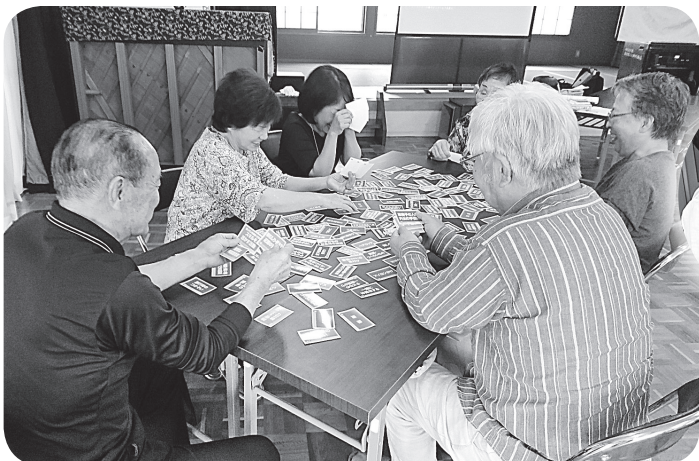
▲みんなで助けあいゲームを行いました。 地域の支えあいの大切さを学びました。