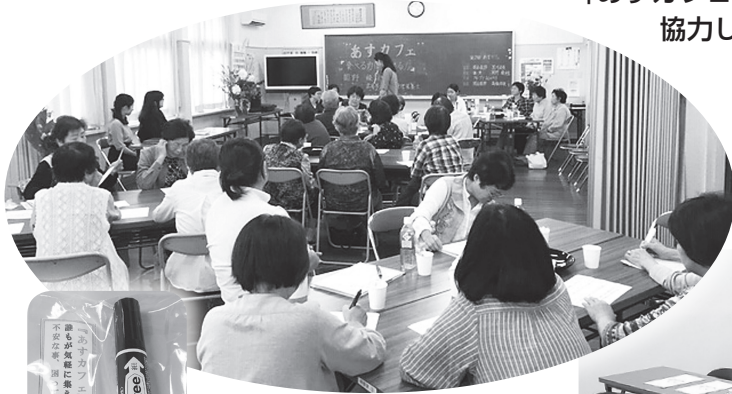
▲安宿住民自治協議会主催 「あすカフェ」

地域で認知症についての講座を行ったり、安宿地域では福祉専門職に誰でも相談できる「あすカフェ」を開設したり、地域・企業・福祉専門職が協力して、負担が少ない見守り活動を進めています。また、商店等の協力による「ゆるやかな見守り活動」も、福富町・豊栄町の担当者で連携して、実現に向けて動いています。