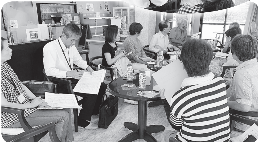
▲小谷地区サロン代表者会議