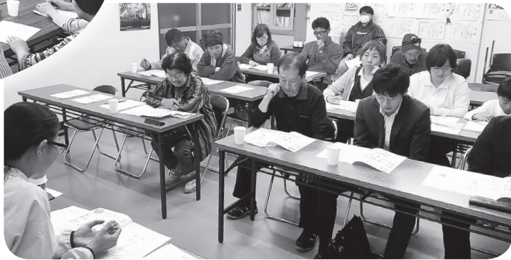
本町商店会 「認知症サポーター養成講座」▶