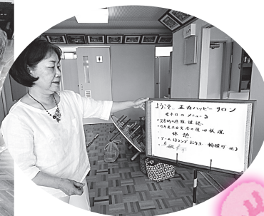
▲初めてのサロンは、 ドキドキのスタート でした。