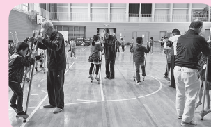
『小学校での昔遊び体験』