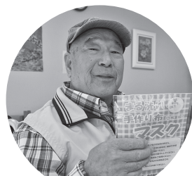
デイサービスセンター (安芸津) とお達者広場 (福富) の利用者さん