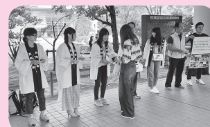
『大学キャンパス内での募金活動』