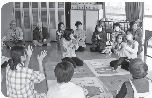
「すすすくサポート志和」参加の様子（令和元年11月）

私たちの地域は少子高齢化の課題に対し、子育て支援も重要な取り組みと考えています。平成29年から本格的にスタートした「こんにちは赤ちゃん訪問」では、保健師の方と連携して、出産されたご家庭を訪問し、赤ちゃんを囲んでお母さんのお話を聞かせていただいています。また、「こんにちは幼児訪問」として1歳のお誕生日頃にお子さんの成長を一緒にお祝いさせていただいています。令和元年には、町内にも「すすすくサポート志和」が開設され、若いお母さん方のよりどころとなっています。