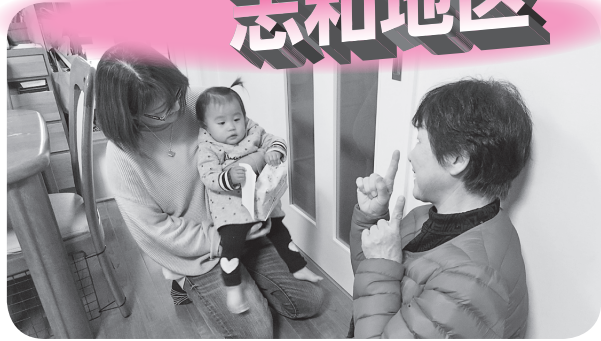
「こんにちは幼児訪問（1歳の誕生日訪問）」の様子（令和2年2月）