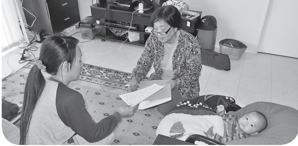
「こんにちは赤ちゃん訪問」の様子（令和元年11月）