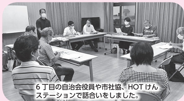
6丁目の自治会役員や市社協、HOT けんステーションで話し合いをしました。

このように、誰もが住み慣れた場所で、いつまでも安心して暮らせるよう、地域の気かけ合いから困りごとを早期発見し、予防、解決していくための支え合いの仕組みづくりが始まっています。