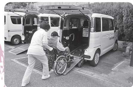
▲利用者の身体状況に合わせた安心安全な送迎

日帰りで入浴や食事などの日常生活上の支援を受けながら、日常生活で生かせる機能訓練、レクリエーションなどを行うサービスです。家族以外の人と交流することで社会との関わりがもて、孤独感の解消や心身機能を維持する機会となり、また介護者の介護負担軽減を目指しています。一步、外に出てみて同世代の方々と交流してみませんか？