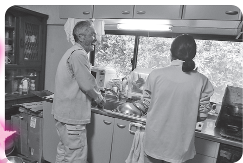
▲一緒に調理を行っています。

要介護・要支援状態の利用者さんに身体介護(入浴・排泄・食事等)、または生活援助を提供するサービスです。在宅で安心して長く生活が送れるように訪問介護員(ホームヘルパー)が支援しています。支援するヘルパーも、日々いろいろなお宅を訪問する中、利用者さんからうれしい声をかけてもらい元気一杯で頑張っています。