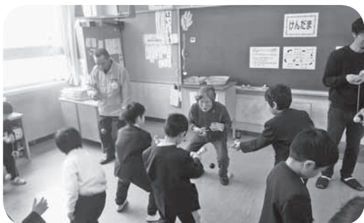
川上小学校 「昔遊び・けんだま」（令和2年1月）

八本松地区では、36名の民生委員児童委員と2名の主任児童委員の計38名が活動しています。