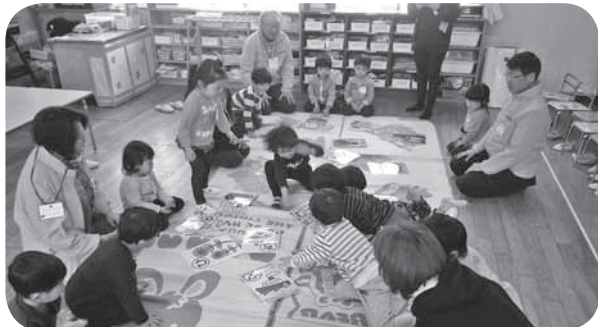
川上東部保育所 「交流会・カルタ」（令和2年1月）