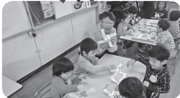
川上東部保育所 「交流会・風車作り」（令和2年1月）