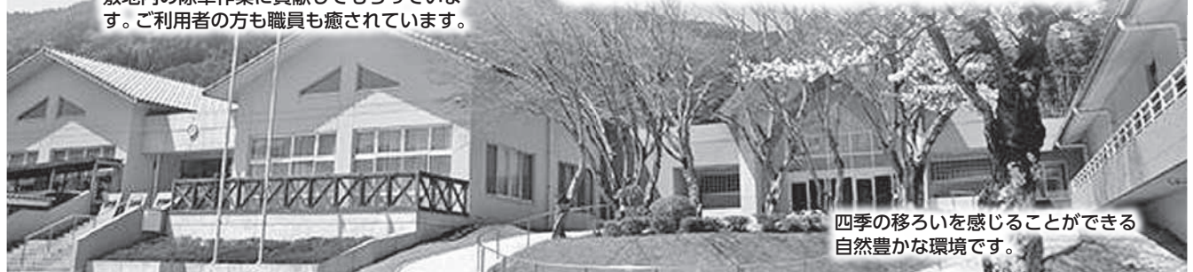
四季の移ろいを感じることができる自然豊かな環境です。

地域貢献活動としては、「住みよい町志和町ネットワーク」へ参加し、町内の6事業所、自治協、地区社協の皆さまと「生活便利マップ」を作成するなど、各事業所の有する専門性と地域のニーズを融合させる取り組みをおこなっています。また、地域の秋祭りや敬老会での太鼓演奏の披露、清掃活動やさまざまな年中行事への参加、市内外の民生委員・児童委員との交流会の開催、中学生職場体験の受入れなど、地域の皆さまと協同して取り組んでいます。今後も皆さまのお力添えをいただきながら、地域のニーズに応じた活動に取り組んで参ります。