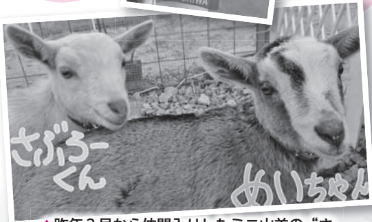
▲昨年3月から仲間入りしたミニ山羊の“さぶろーくん”と“めいちゃん”です！ 敷地内の除草作業に貢献してもらっています。ご利用者の方も職員も癒されています。

当園は、東広島市志和町の自然豊かな環境の中で、ご利用者に対して安心して生活できる暮らしの場と生活上の必要なサービスを提供しています。