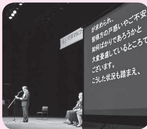
▲ぐるマルフェスタにて、市長が話されている場面。要約筆記は色々なところで活躍しています!

また、要約筆記奉仕員養成講座を終えた方も毎年加入し、新旧入り乱れて楽しく活動しています。是非一緒に「花たば」で要約筆記について学びませんか?