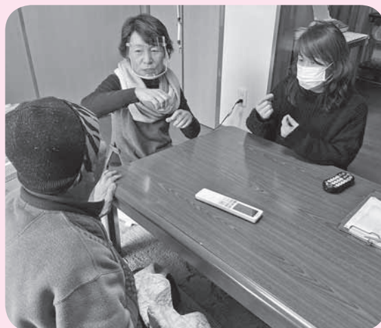
▲コロナウイルス感染予防対策をして、手話で楽しくお話し活動

現在、8名のメンバーが手話のできるボランティアとして活動に参加しています。サークル活動の中からも、見守り・支え合いの活動の輪が広がっています。