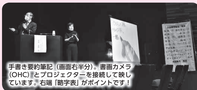
手書き要約筆記 (画面右半分)。書画カメラ (OHC) とプロジェクターを接続して映しています。右端「略字表」がポイントです!