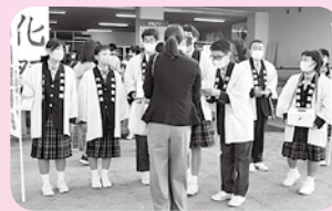
松賀中学校文化祭