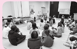
子育てサロンバナナ