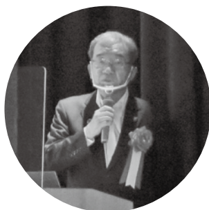
高垣市長の記念講演