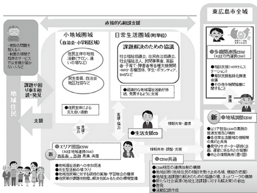
(東広島市作成資料)