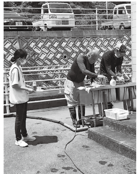
感染症対策を徹底し、ボランティア活動を行いました。