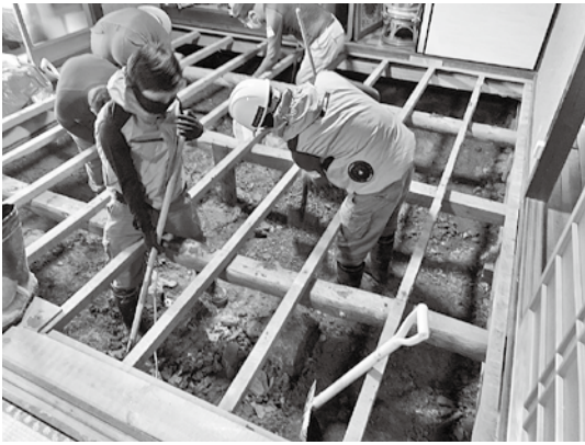
床下に入った土砂を取り除きました。