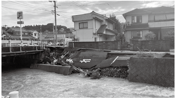
道路が崩落するなどの大きな被害もあった安芸津町。

このたびの大雨によって被災された住民の皆様にご協力をお願いいたします。 今後とも、本会ボランティア活動について皆様のご協力をお願いいたします。