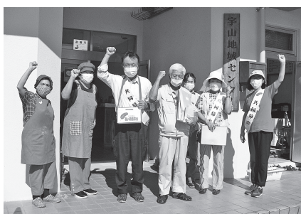
■ 河内町 河内町内を回りながら募金への協力をお願いしました☆☆