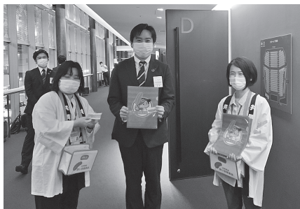
■ 芸術文化ホールくらら 東広島青年会議所の例会でも募金活動をさせていただきました。

今年も10月1日から全国一斉に共同募金運動が始まりました。各地区の募金運動では、多くの方にご協力をいただきありがとうございます。募金運動は3月31日まで行いますので、引き続きご協力をお願いいたします。