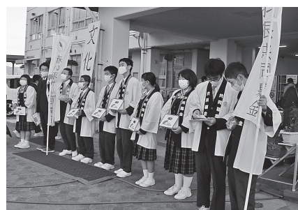
■ 松賀中学校 今年も文化祭で募金活動を行ってくださいました☆同時に、自分たちで共同募金について調べて、展示もしていただきました。