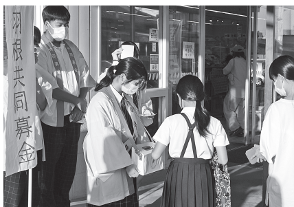
■ ゆめマート安芸津店 豊田高校の学生さんと一緒に募金活動をしました！