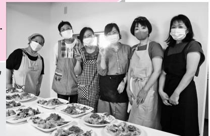
西条子ども食堂コジー

主催／西条子ども食堂コジー 開催日時／第3土曜日 11:30～ 活動場所／社会福祉法人愛和福祉会 かなの家(西条町御園宇6231-1) 活動内容／昔遊び、作って遊ぼう、季節の催し、お昼ご飯 参加費／子ども200円、大人300円 ボランティア募集／募集中