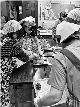
SATO☆まきばのばんごはん

「家族で過ごすような温かい場所や食事を提供してあげたい」「地域のつながりづくりをしたい」という温かい気持ちの輪が広がって、誰もが参加できる「地域食堂」や「子ども食堂」がたくさん生まれています。社協も活動を応援しています。