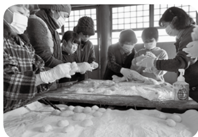
参加者から頂いたもち米で餅つき会をしました