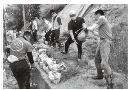
災害ボランティア活動