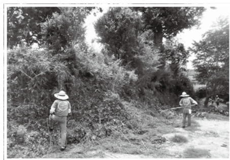
地域の拠点作りの手伝い