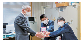
福富小学校からも寄付が届きました