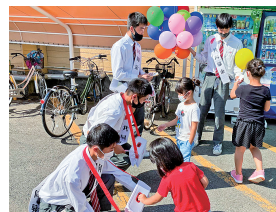
黒瀬高校の生徒さんとビッグハウス黒瀬店で募金活動