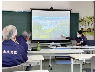
サンクリニックみながの方