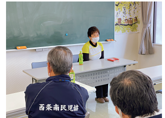
るるん御園宇の方