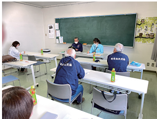
地域包括支援センターの方

これからも、つながりの輪を広げ、さらに高齢者の方へ寄り添った見守り活動ができればと思っています。