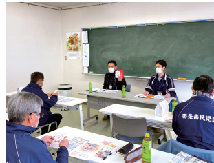
特別養護老人ホーム 長寿苑の方