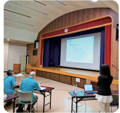
アース製薬株式会社様より、分かりやすく教えていただきました。